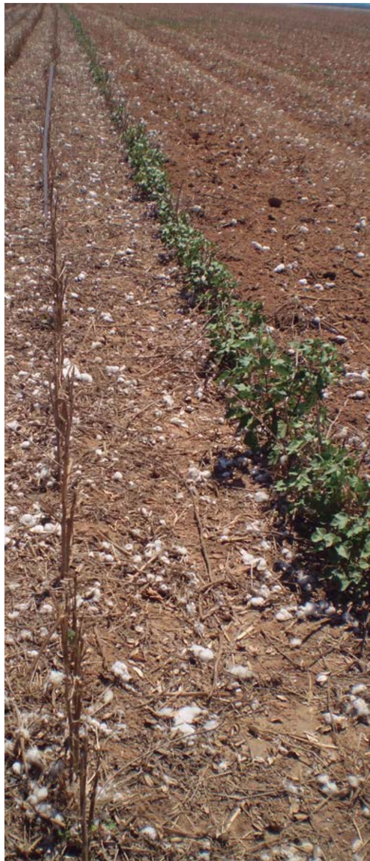
Linha Testemunha auxiliar ao lado das parcelas que receberam aplicação de herbicida na destruição de soqueira.

Num futuro próximo, variedades com resistência adicional ao herbicida 2,4-D deverão chegar ao mercado, e nessas a destruição química de soqueira poderá ficar comprometida, considerando as atuais ferramentas hoje disponíveis.